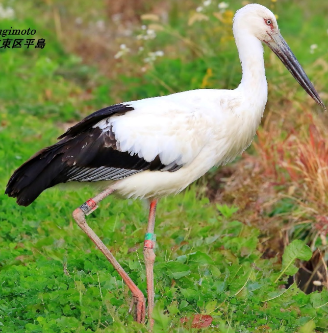
2019/11/13 岡山市東区平島 畔に立つコウノトリ 特別天然記念物