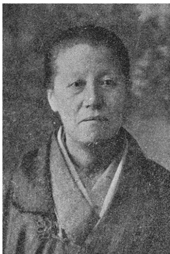
図3 奥村五百子 (1845-1907)

これらの教育活動以外にも、歌子は様々な社会活動を実行しています。日清戦争が終了し、社会に多数の遺族や負傷した兵士が発生しました。それらの人々を救済するため、幕末に男装で尊王攘夷運動に活躍した女傑の奥村五百子(図3)が明治三四(一九〇一)年に「愛国婦人会」を創設しますが、歌子は設立に協力します。愛国婦人会は以後も日露戦争や第一次世界大戦の遺族救済だけではなく、関東大震災の救済や復興支援にも活躍します。