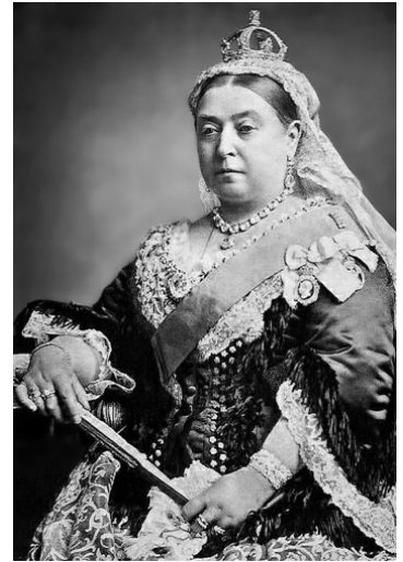
図2 ヴィクトリア女王 (1819-1901)

ヨーロッパからアメリカに移動し、アメリカ大陸を横断して帰国します。この視察の結果、国家の発展のためには上流階級だけではなく一般庶民の学校教育も重要であることを痛感するとともに、その内容も女子を対象とした教養科目だけではなく専門科目も重要であり、知育や徳育とともに体育も必要あることを確信するようになります。このときの経験が後述するように自身で女子のための学校を創設する動機となります。