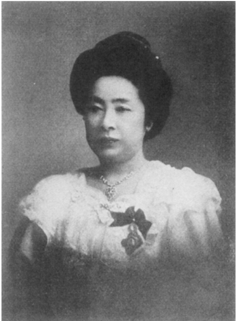
近代の女子教育に尽力した下田歌子（1854—1936）