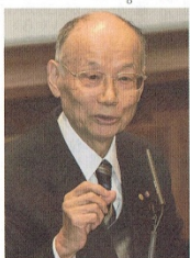
図2 A・ Fleming(1881-1955)