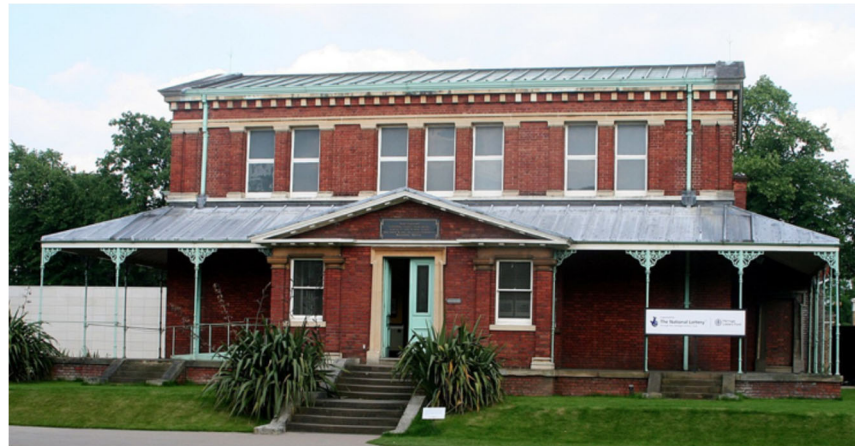
図2 マリアンヌ・ノース・ギャラリー

園内には数多くの施設がありますが、ひととき目立つ巨大な温帯温室（図1）の背後に「マリアンヌ・ノース・ギャラリー」という煉瓦で構築された目立たないが風格のある建物があります（図2）。ここには一人の女性が大英帝国の領土を中心に世界各地を旅行しながら、それぞれの旅先で植物の生育する自然を描写した絵画八三二点が室内の壁面一杯に展示されています（図3）。その画家が今回紹介するマリアンヌ・ノースです。