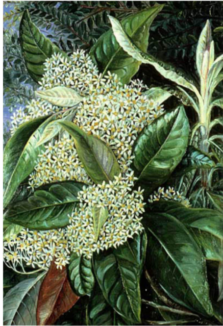
図3 マリアンヌ・ノースの絵画